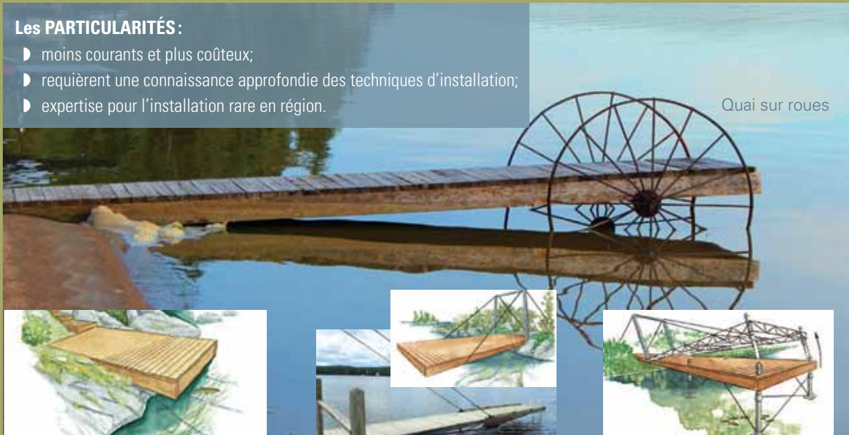
Quai sur roues