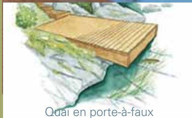
Quai en porte-à-faux