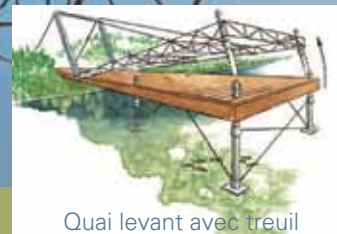
Quai levant avec treuil