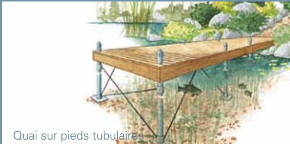
Quai sur pieds tubulaires