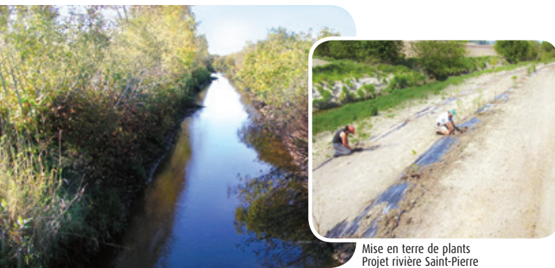
Bande riveraine implantée depuis 15 ans Projet rivière Fouquette

Producteur agricole Comité de bassin du projet ruisseau des Aulnages