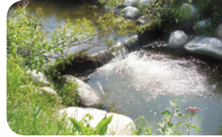
Projet rivière Boyer Sud

Un petit seuil en bois ou en enrochement permet la création de fosses et de petites chutes, qui deviennent des sites d'alimentation et de repos. Pour être franchissable par les ombles de toutes tailles, la hauteur du seuil ne doit pas excéder 30 cm.