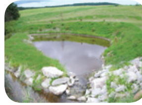
Projet rivière Niagarette

Ces bassins permettent d'absorber une partie des eaux de crue et de diminuer la force érosive sur les berges et le fond.