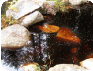
Association chasse et pêche Bouillé

Un abri bien aménagé imite les structures naturelles retrouvées dans un cours d'eau en bonne condition, comme des pierres et des troncs d'arbres.