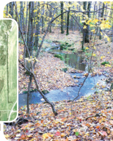
Remise en eau d'un ancien lit de la rivière Boyer Sud avec ses méandres