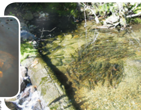
Frayère sur lit d'un cours d'eau