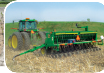
Projet rivière Niagarette