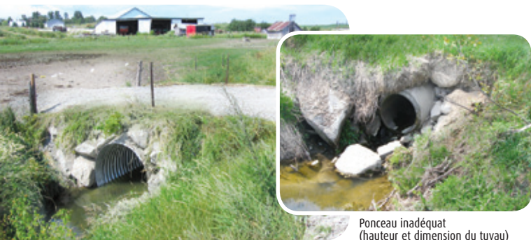
Ponceau bien aménagé Projet ruisseau Morin

Buts visés • En plus de corriger les problèmes d'érosion et d'écoulement d'eau, la réfection de ponceau permet la libre circulation des poissons et redonne accès à des habitats situés en amont du ponceau. Afin de préserver les conditions naturelles d'écoulement de l'eau, l'utilisation de structures à portée libre (ponts, passerelles) et les ponceaux en arche sont préférables à l'implantation de ponceaux fermés (tuyaux), qui sont illustrés dans les exemples qui suivent.