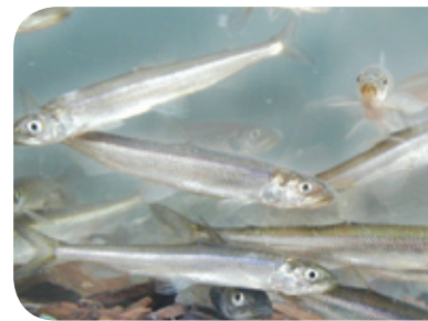
Éperlans arc-en-ciel

La rivière Fouquette abrite l'une des quatre frayères d'éperlan arc-en-ciel du sud de l'estuaire du Saint-Laurent. Les actions menées pour réduire l'érosion dans le bassin versant de la rivière Fouquette s'ajoutent aux initiatives mises de l'avant pour assurer sa préservation.