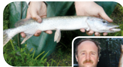
Grand brochet Projet ruisseau Richer

ment le fouille-roche gris et le méné laiton, des espèces en situation précaire de la plaine du Saint-Laurent. La survie de ces espèces dépend à la fois de la qualité des eaux et de la préservation de leurs habitats.