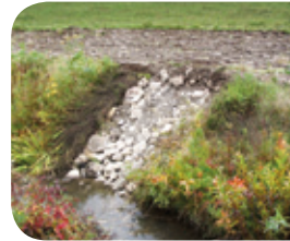
Projet rivière Fouquette

Divers ouvrages hydro-agricoles (chutes enrochées, avaloirs, etc.) permettent de limiter la perte de sol vers le cours d'eau. Ils sont un complément aux pratiques de conservation des sols et aux bandes riveraines.