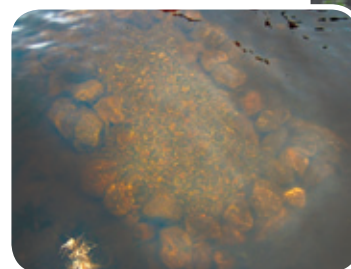
Caisse-frayère Association chasse et pêche Boullé