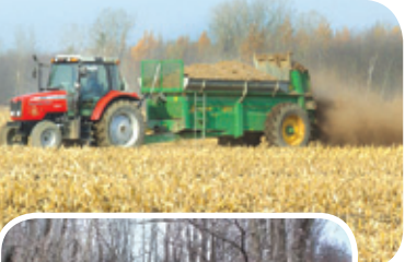
Projet ruisseau des Aulnages

La gestion optimale des fertilisants et des pesticides permet de minimiser l'apport de composés non désirables dans les cours d'eau.