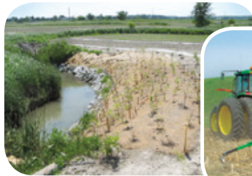
Projet ruisseau Richer

Le nivellement et la plantation de végétaux dans les berges sensibles à l'érosion permettent de les stabiliser de façon efficace. Un enrochement en pied de talus est parfois requis.