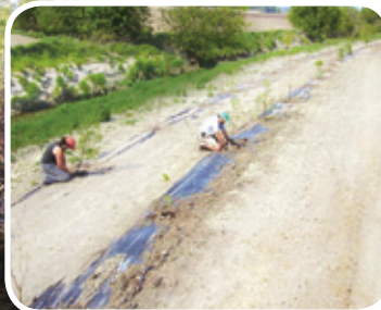
Mise en terre de plants Projet rivière Saint-Pierre