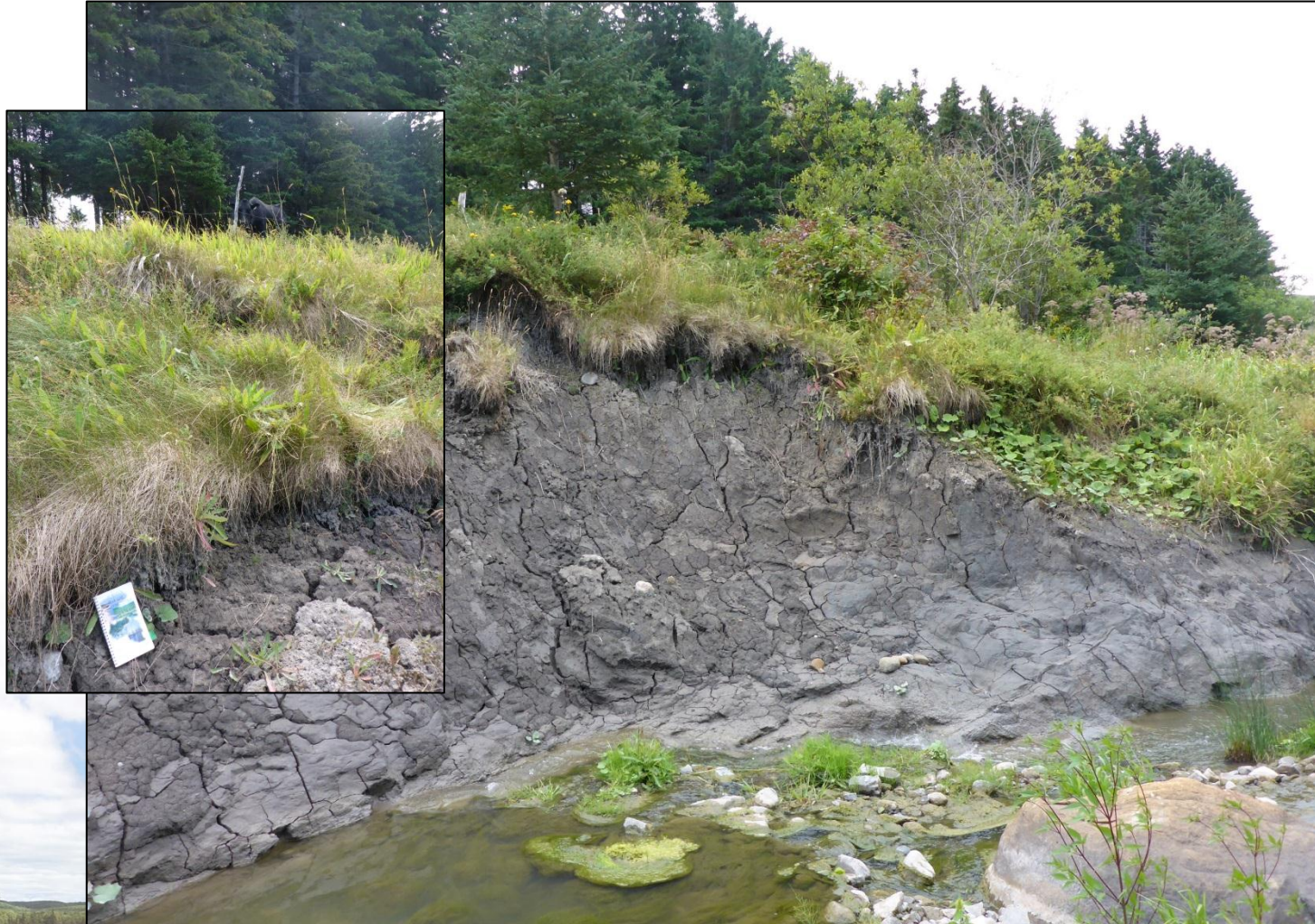
Glissement superficiel dans dépôts argileux