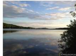
Lac Saint-Mathieu

L'OBVNEBSL espère réunir autant les citoyens, les villégiateurs, les agriculteurs et les représentants des secteurs municipal, récréatif, forestier et industriel afin de prioriser les enjeux reflétant les besoins et les attentes de la population. « Il est primordial que les citoyens se prononcent sur les préoccupations qui les concernent afin de prioriser les enjeux et d'orienter les actions de notre organisme et des ses partenaires. La formule du forum ouvert rend l'ambiance très conviviale et permet aux citoyens de discuter en tables rondes