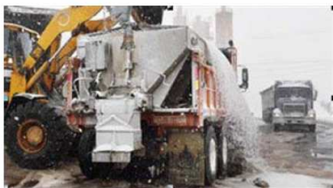
Du sel pour déglacer les routes

Des préoccupations environnementales forcent les municipalités du Bas-Saint-Laurent à revoir l'utilisation des sels de voirie.